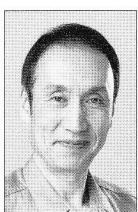
大森博史 六代目円生こと 山崎松尾