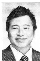
ラサール石井 五代目志ん生こと 美濃部孝蔵