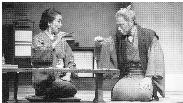
「滝沢家の内乱」 (2011年初演)

文政十年。「南総里見八犬伝」執筆中の滝沢馬琴の、息子・宗伯のもとに嫁いできたお路。高名な先生のお家と安心しきっていたが、そこはほんでもない家だった!! 一癖も二癖もある滝沢家の人々とのしつちやめつちやかな毎日の中で、読み書きのできなかったお路が、目を患った馬琴に文字を教わりながら「八犬伝」を脱稿へと導く――。 頑固な馬琴に負けず、前向きに奮闘するお路の姿が多くのお客様の共感を呼び、風間杜夫と高畑淳子が声だけで流石の存在感を示したと話題になった、2011年の初演から4年。 数多くのお客様から再演熱望の声を頂き、あの笑って泣いて大忙しのカトケン版時代劇が、再び幕を開ける!!