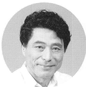
滝沢馬琴 加藤健一