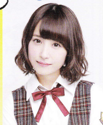
衛藤美彩(乃木坂46) ※Wキャスト