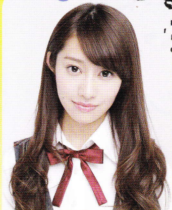
桜井玲香(乃木坂46) ※Wキャスト